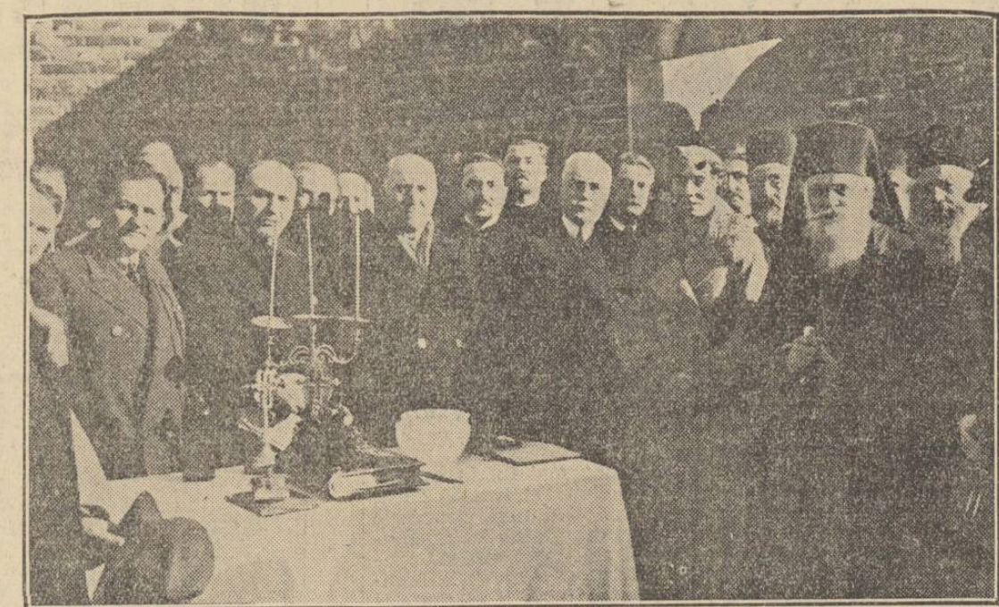
I. P. Sf. patriarh vorbind la sfințirea bisericii din Buftea